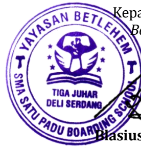
Kepala SMA Satu Padu Boarding School