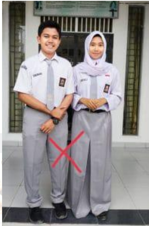
Model Warna Seragam Nasional SMA