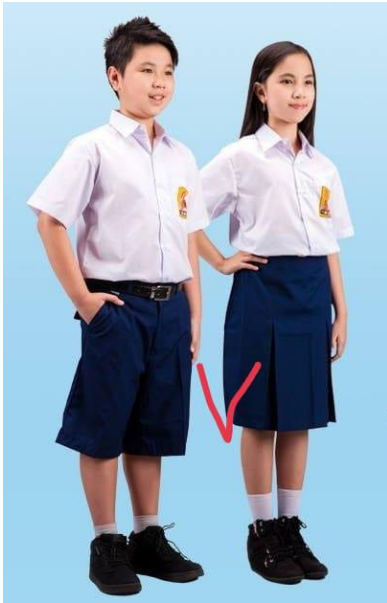
Warna Seragam Nasional SMP