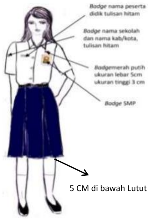
Model Seragam Nasional SMP